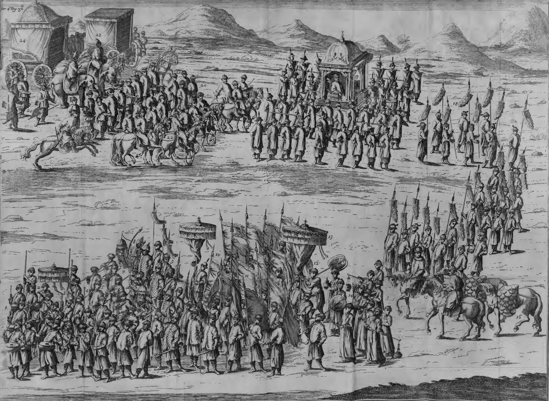
Accompagnamento dell'Imperator della Cina quando comparisce in forma pubblica